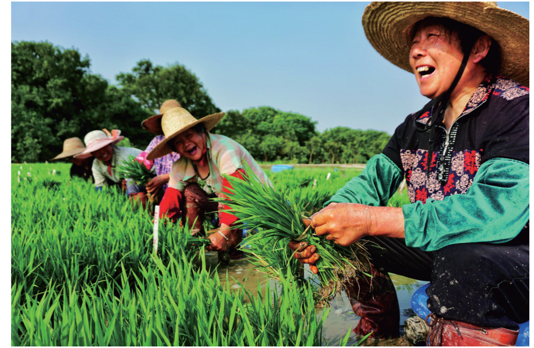
《中国梦 劳动美》