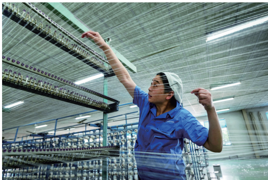
《丝丝入扣》