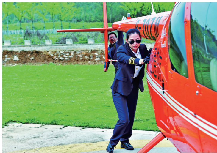
《90后“女机长”蓝天下,绽放飒爽英姿》