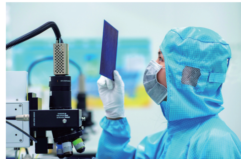
《天合光能无尘车间》