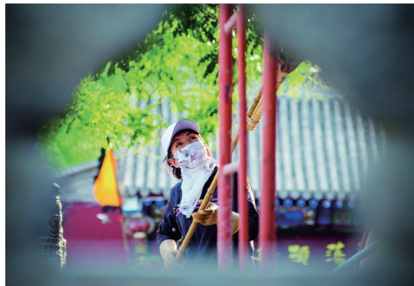
《让我们的环境越来越美》