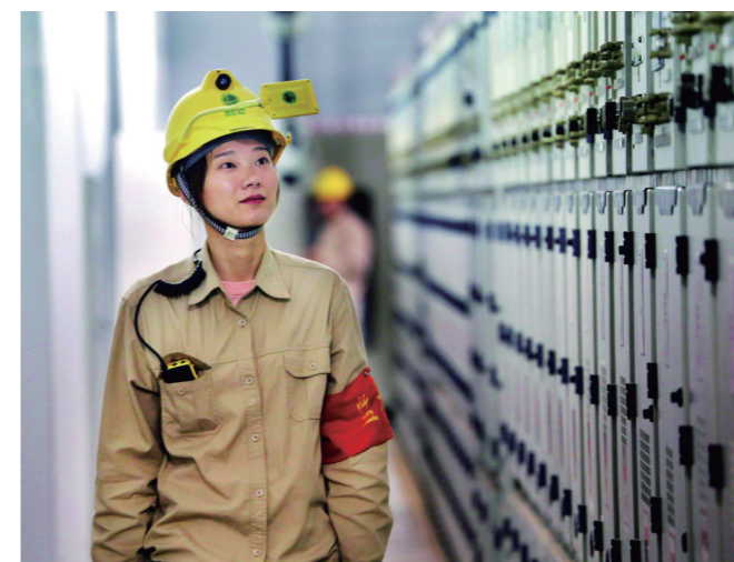
《紧绷安全弦》