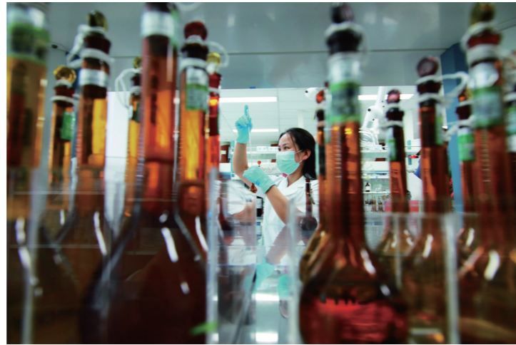
《聚力净化环境 打造最美家园》