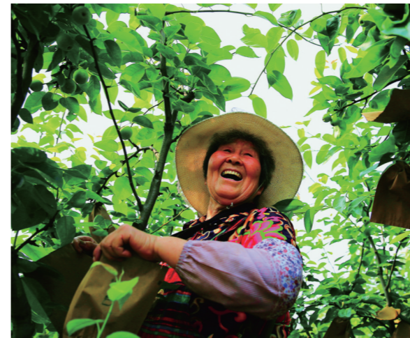
《快乐阿婆》