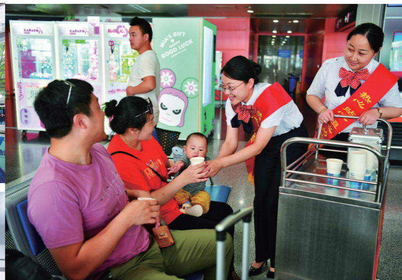
《宾至如归》