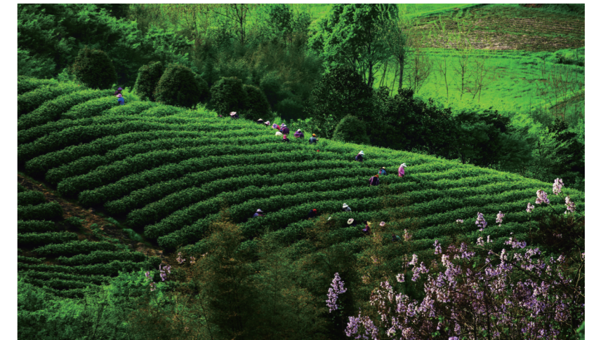
《春到茶园》