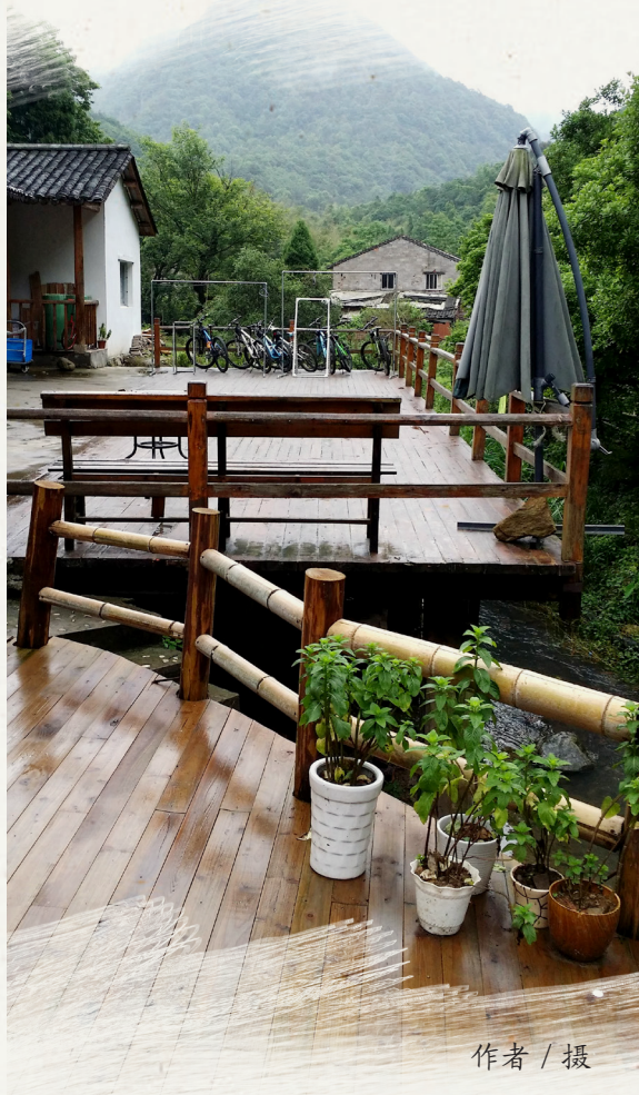
作者 / 摄

● ● 突然想起她的书《在藏地》封面上的一句话：这世界有那么多我不需要的东西——苏格拉底。