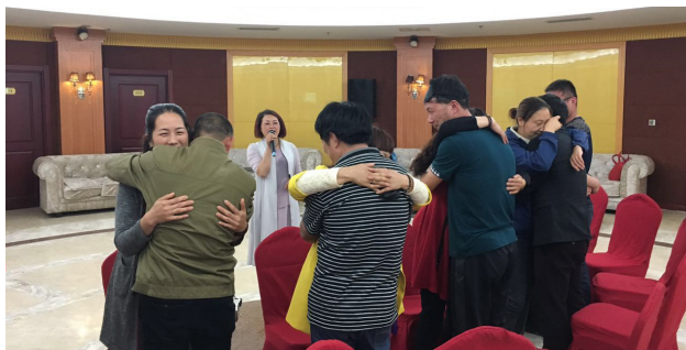
图为团辅活动后夫妻和解

姻登记窗口开展试点，通过“家和关爱 维情援助”和“和谐婚姻 幸福家园”两个市妇联公益创投项目，由承接的社会组织对协议离婚案件开展辅导，引导夫妻双方慎重理性经营婚姻，促成部分个案家庭情感回归，目前两个项目已经完成195对协议离婚夫妇的社工辅导，劝和54对夫妇，占27.6%。