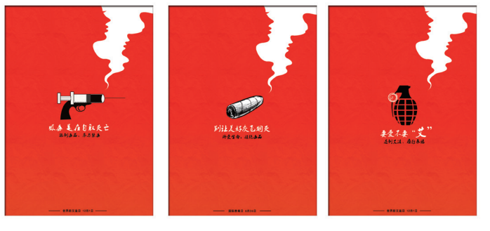
图为一等奖获奖作品

6月，常州市妇联投入专项资金，购买社会服务开展“向阳花行动——常州市女性禁毒防艾项目”，旨在提高目标人群对毒品、艾滋病的认识，增强防范意识，倡导和谐社会建设。项目开展以来，创