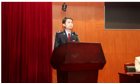
机关党员代表发出“共建清廉家庭”倡议

二是举办家庭文化活动，树立清廉治家理念。寻找并征集现代优秀家训，挖掘家训家规背后的家庭故事；征集清廉书画作品，并将优秀作品以汇编、展览等形式加以宣传；组织开展常州历史文化名人家规家训、廉洁箴言征集活动，整理提炼龙