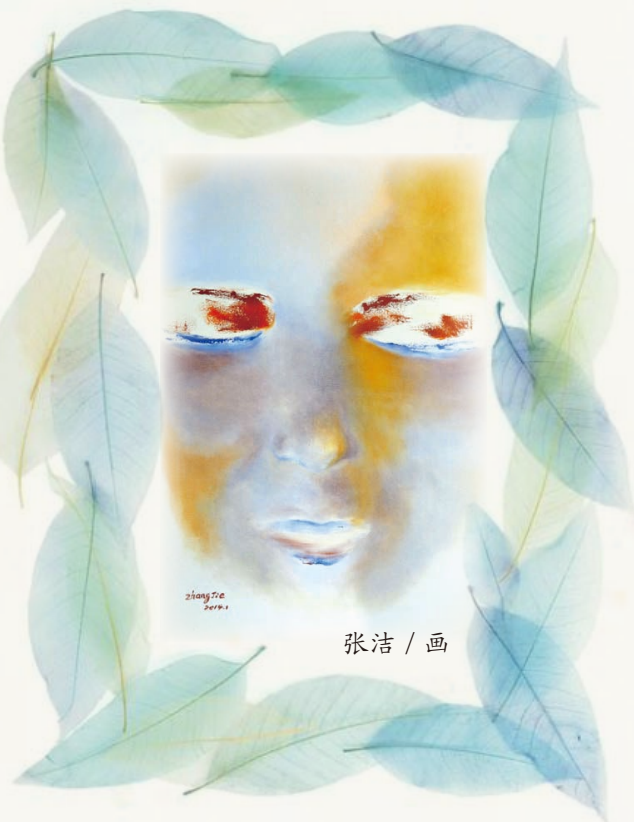
张洁 / 画

红日我去过。新开不久，就以其便捷的地理位置，专业的养老设施，人性化的管理模式吸引了不少中产阶层的老人及其子女。因为同事及朋友不约而同选择了将父母寄居在那。那个春日，为了预习晚年生活，我也顺便去探访过一次。看到工作人员正带领一帮老人——老人人手一页放大字号的歌词——大家集体高唱革命歌曲，那一幅人生暮年场景，真叫人喜忧杂陈，感慨良多。勤勉的工作人员，适合老人的烂糊营养餐，规律的作息时间表，走廊上、卫生间的扶手，房间里的呼叫器，24小时值班的医生，老年人的群体以及川流不息的家属……这一切都让入住的老人们比较舒心。