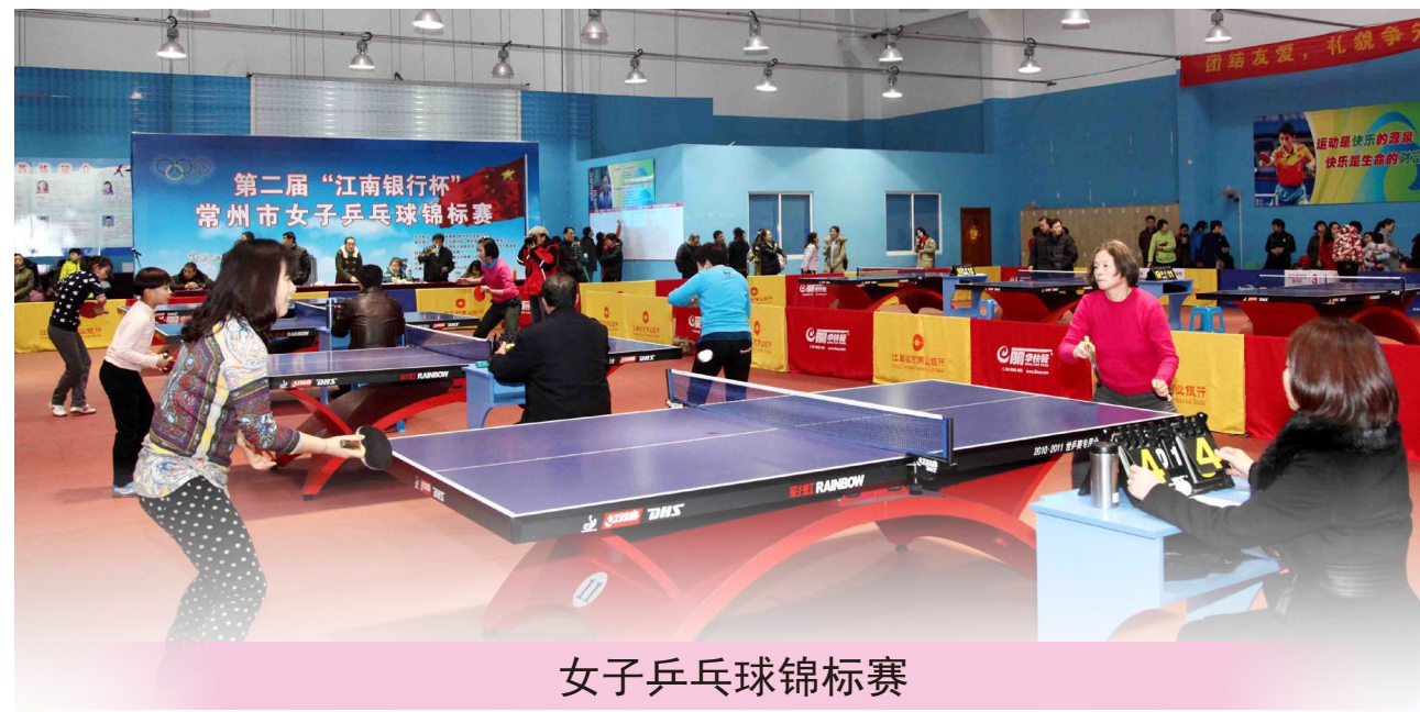
女子乒乓球锦标赛

为体现女性科学健身的良好精神风貌，3月7日，市体育局、市妇联在仙鹤体育中心乒乓馆联合开展第二届“江南银行杯”常州市女子乒乓球锦标赛，全市364名女运动员参加比赛。经过激烈角逐，市女干联七分会、六分会、四分会分获市女干联团体比赛前三名；市女知联常工院分会、河海大学分会和卫生分会