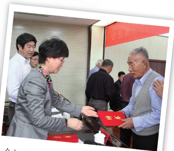
会上，为“家庭园艺指导师”代表发放了聘书