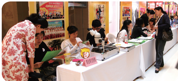
常州市妇联举办“与爱同行、巾帼志愿者在行动”集中服务活动，向市民免费提供心理咨询、珠宝鉴定、家教咨询、妇女维权、健康义诊等服务项目

巾帼志愿者们走近空巢老人、单亲贫困母亲、流动留守儿童以及失独家庭、特殊孩子身边，送去儿女、母亲般的关怀。