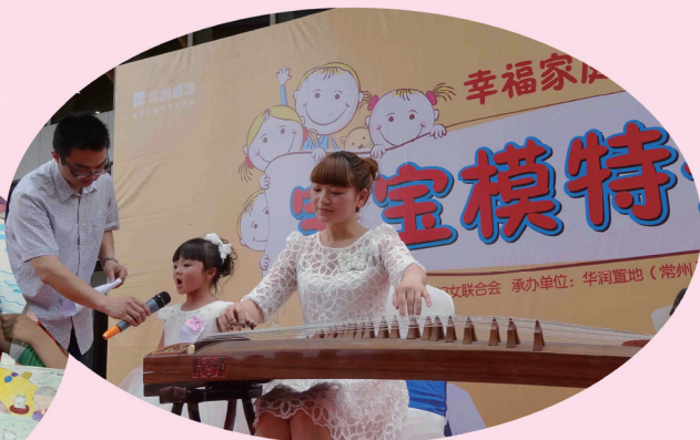
市妇联举办“华润杯”幸福家庭宝宝模特秀才艺比赛，充分发挥家庭文化志愿者在社区和家庭中才艺展示中的作用。