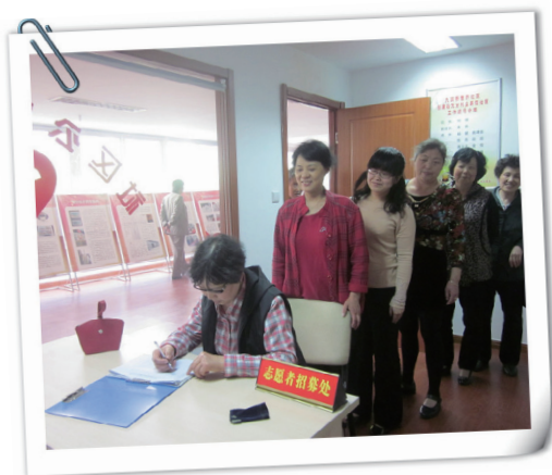
天宁区九洲新世界招募点

在妇女儿童活动中心、妇女儿童之家以及社会热心组织广泛设置1200多个招募点，绘制“巾帼志愿服务导航图”，呼吁更多人加入巾帼志愿者的行列，更加人通过身边的阵地、身边的组织参与各类巾帼志愿服务。