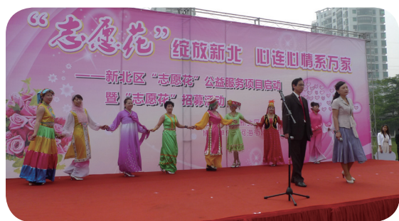
“志愿花”绽放——新北区巾帼志愿者启动“志愿花”公益服务项目，重点为全区单亲贫困家庭、空巢老年妇女、病残妇女儿童、流动留守妇女儿童、失独家庭、婚姻家庭问题求助妇女以及其他各类需要帮带助困的妇女和儿童，实现包括助学帮困、法律援助、心理咨询、婚姻家庭辅导、家教支招、邻里互助等的“微公益、微心愿”。