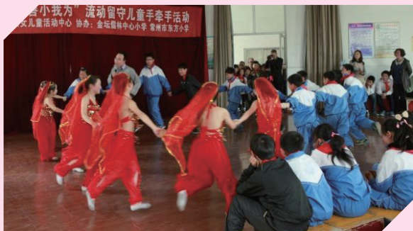
市妇儿活动中心组织心理志愿者到金坛市儒林中心小学开展“感恩社会 善小我为”关爱流动留守儿童——城乡儿童手牵手活动，引导城乡儿童们在受助中传递助人的快乐。