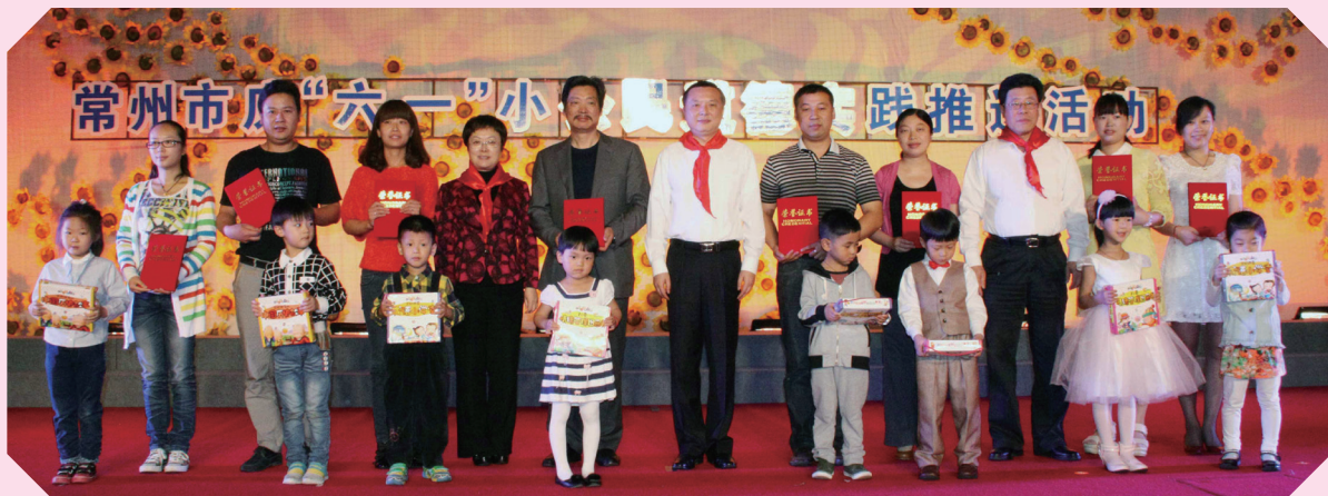
市领导为“感恩社会，善小我为”亲子讲美德故事大赛获奖代表颁奖。