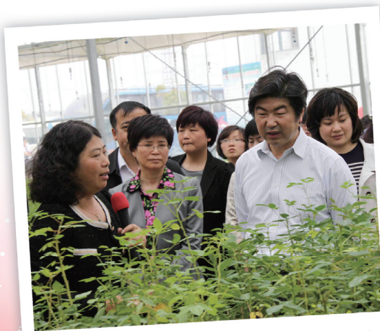
与会人员参观了成章花木女能手种植基地、江苏花海种苗科技有限公司、常州艺林园，实地了解女性带头人投身花博、建设美丽常州的业绩

与优化农村产业结构、发展经济林果、促进农民增收致富紧密结合，把农村打造成“村村优美、家家富裕、户户文明、处处和谐、人人幸福”的宜业宜居宜游的美丽乡村，使“美化家园行动”成为具有深刻意义的生态文明新课堂。