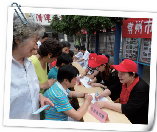
钟楼区清三社区招募点