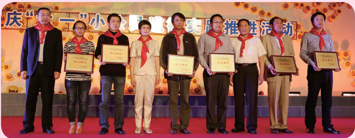
6家爱心企业参与“让心不再留守，让爱传递温情”儿童安全守护公益活动并进行现场授牌。