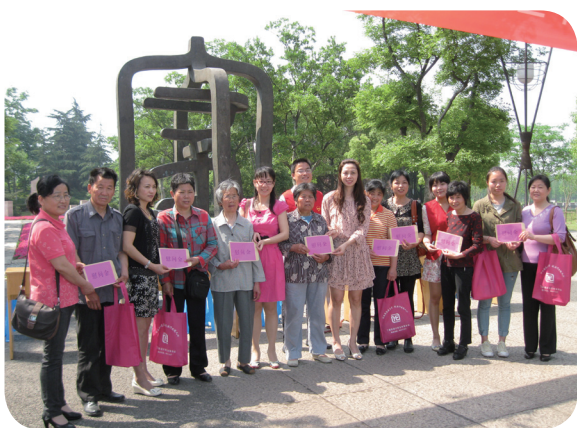
戚墅堰区圩墩公园开展的“情牵贫困母亲，共建美丽家园”志愿服务活动