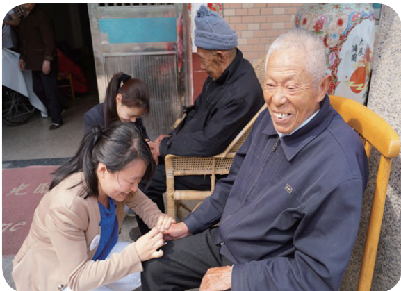
武进区古方社区巾帼志愿者做空巢老人的贴心小棉袄