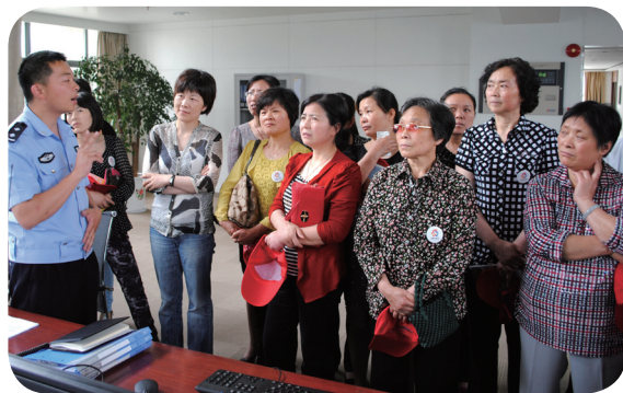
文明交通我先行——溧阳市巾帼志愿者参加新交通法规解读讲座，为做好交通文明志愿工作及时“充电”