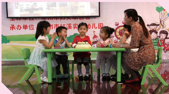
市妇联主办、市红溪幼儿园承办“感恩社会，善小我为”亲子讲美德故事大赛，80多个家庭的幼儿与家长精心准备了音诗画、朗诵、快板、相声、绘本剧等多种节目类型。