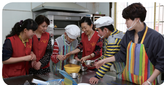
市建设局排水管理处的巾帼志愿者们来到常州天爱儿童自闭症康复中心，带着学校急需的电子称、裱花嘴、黄油、面粉等材料，和面点制作班的孩子们一起制作小熊饼干。