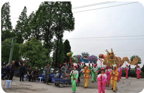
金坛市直溪镇文化巾帼志愿者，关爱农村空巢老人送文艺进村