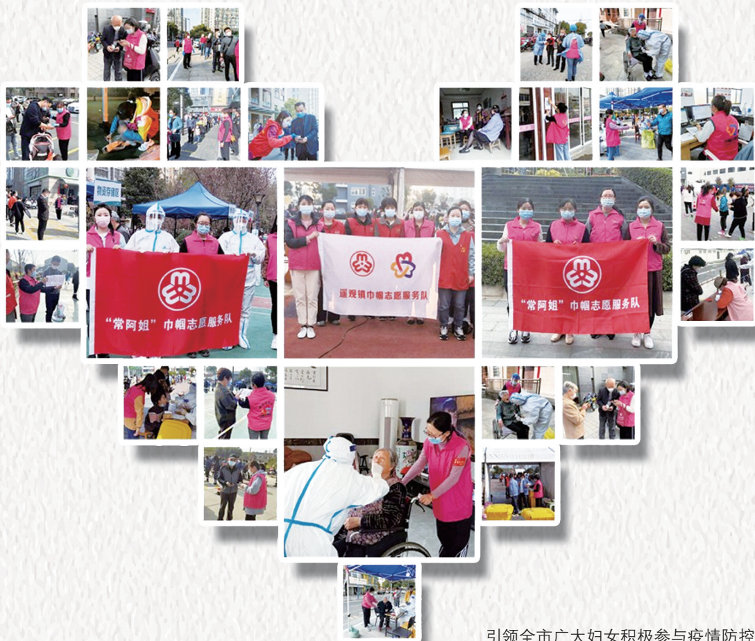
引领全市广大妇女积极参与疫情防控