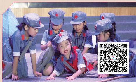
红溪实验幼儿园《我爱你,中国》