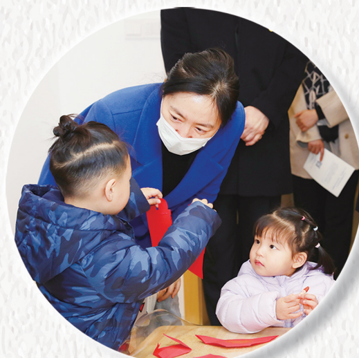
市长盛蕾赴红溪早教托育中心 调研幼儿托育民生实事项目