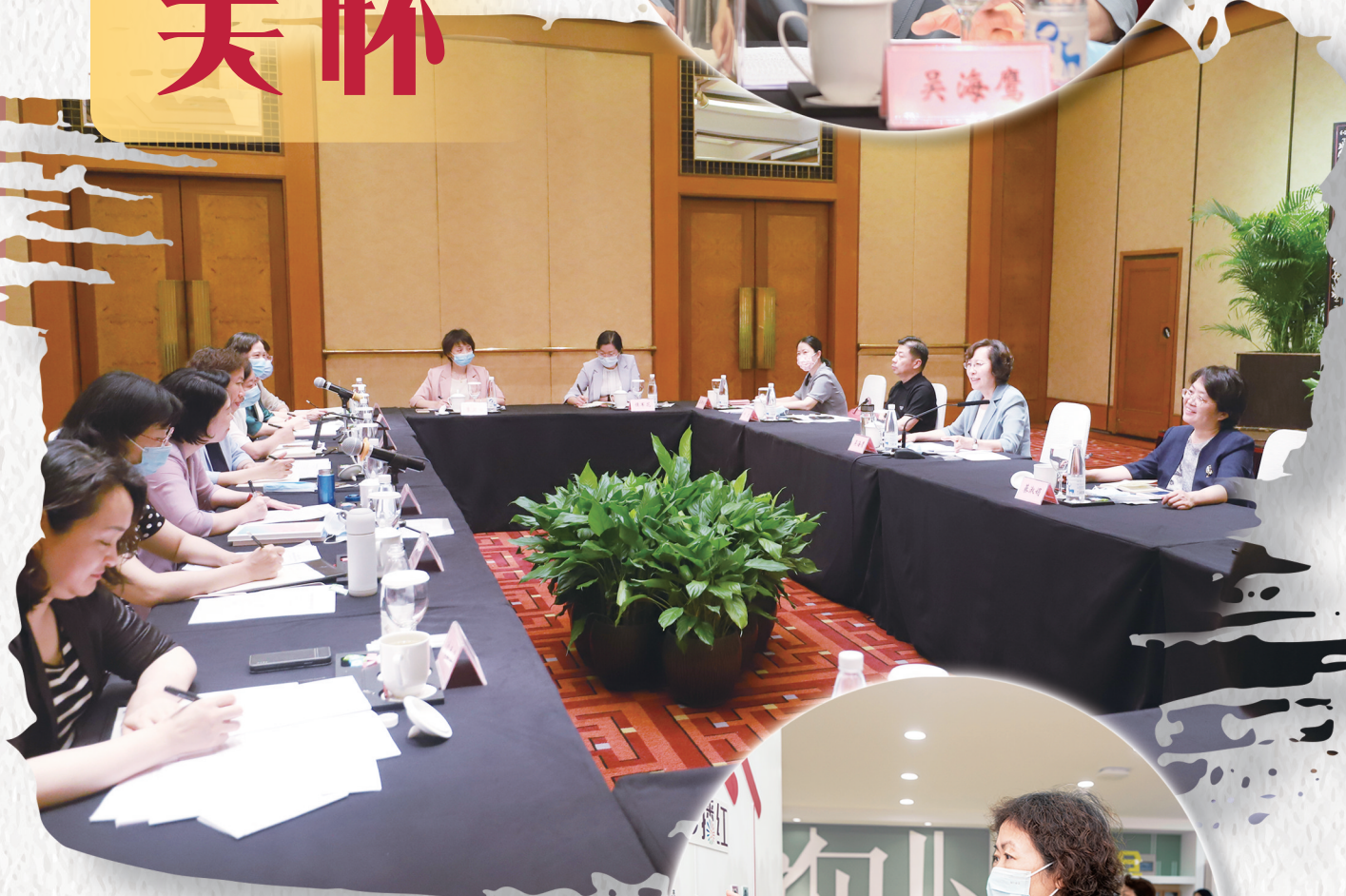
全国妇联副主席吴海鹰到江苏调研妇女思想政治引领工作,专门听取常州汇报,给予高度肯定