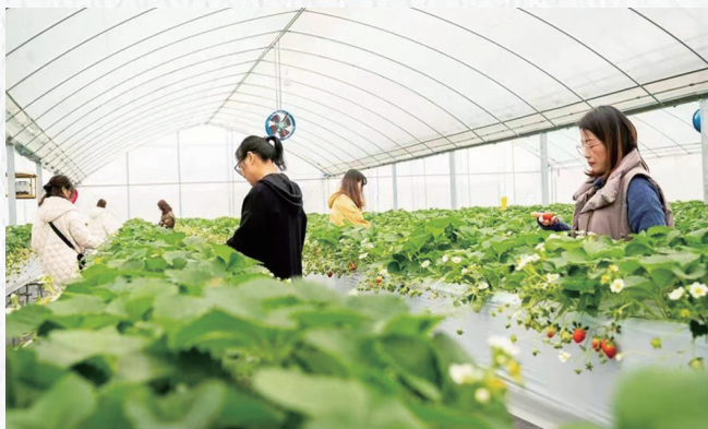
红颜草莓现代化种植基地