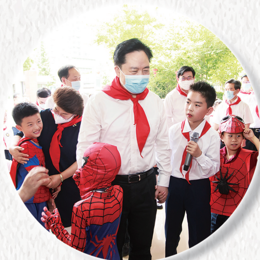
市委书记陈金虎参加 “强国复兴有我 童心筑梦未来”六一儿童节主题活动