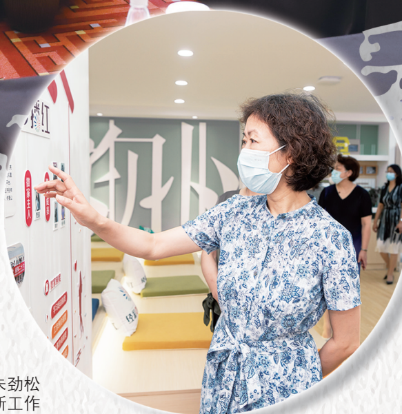
省妇联党组书记、主席朱劲松 调研我市妇联改革创新工作