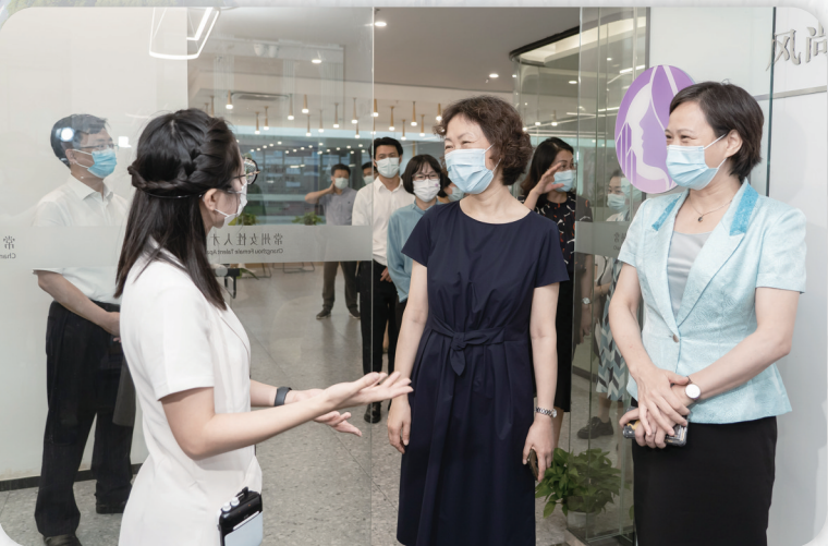
省妇联主席朱劲松调研参观我市女性人才公寓建设