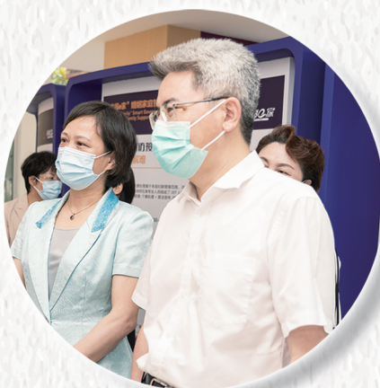
市委副书记、政法委书记梁一波 调研市妇联工作