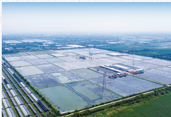
诺亚方舟现代科技河蟹养殖基地