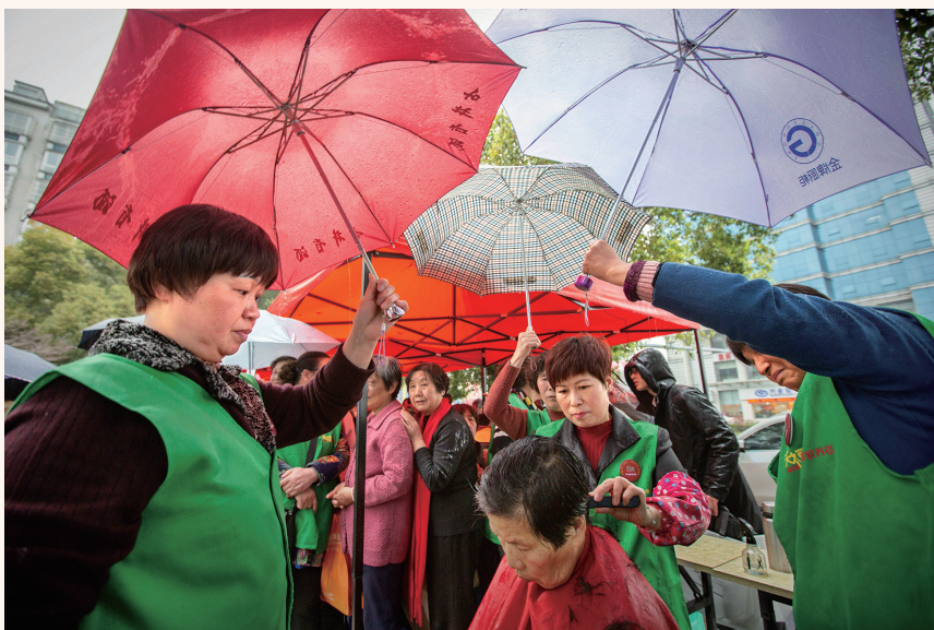
▲ 《撑起爱心伞》