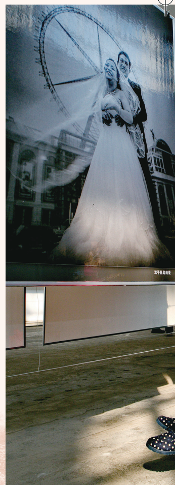
《瞧瞧咱们的婚纱照》 ▶