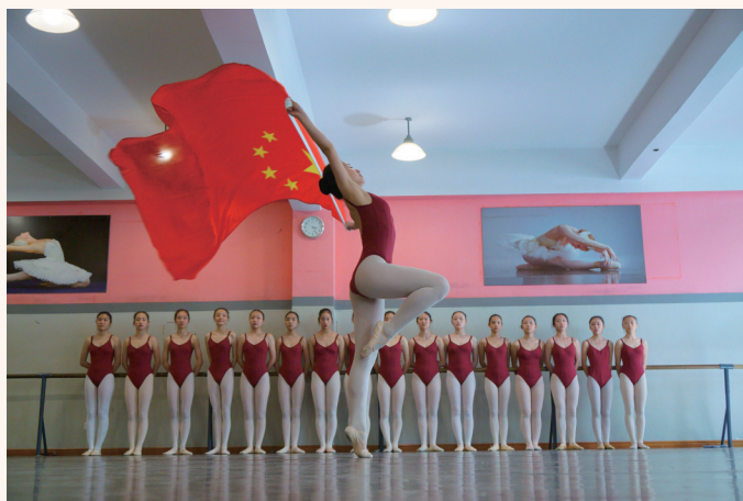
▲ 《中国梦 红色的梦》