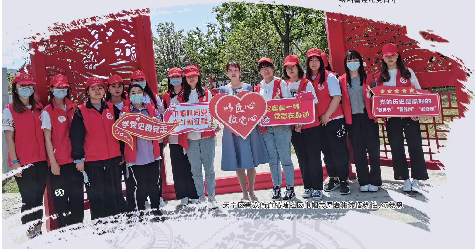
天宁区青龙街道横塘社区巾帼志愿者集体悟党性、颂党恩