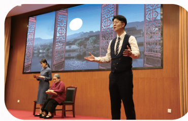
首场家风讲堂宣讲了赵一曼、恽代英、张太雷的家风故事

活动现场为“家风讲堂”宣讲团成员颁发聘书,机关最美家庭代表发出“廉洁的你、幸福的家”清廉家风建设倡议,并进行了百场家风讲堂第一讲。