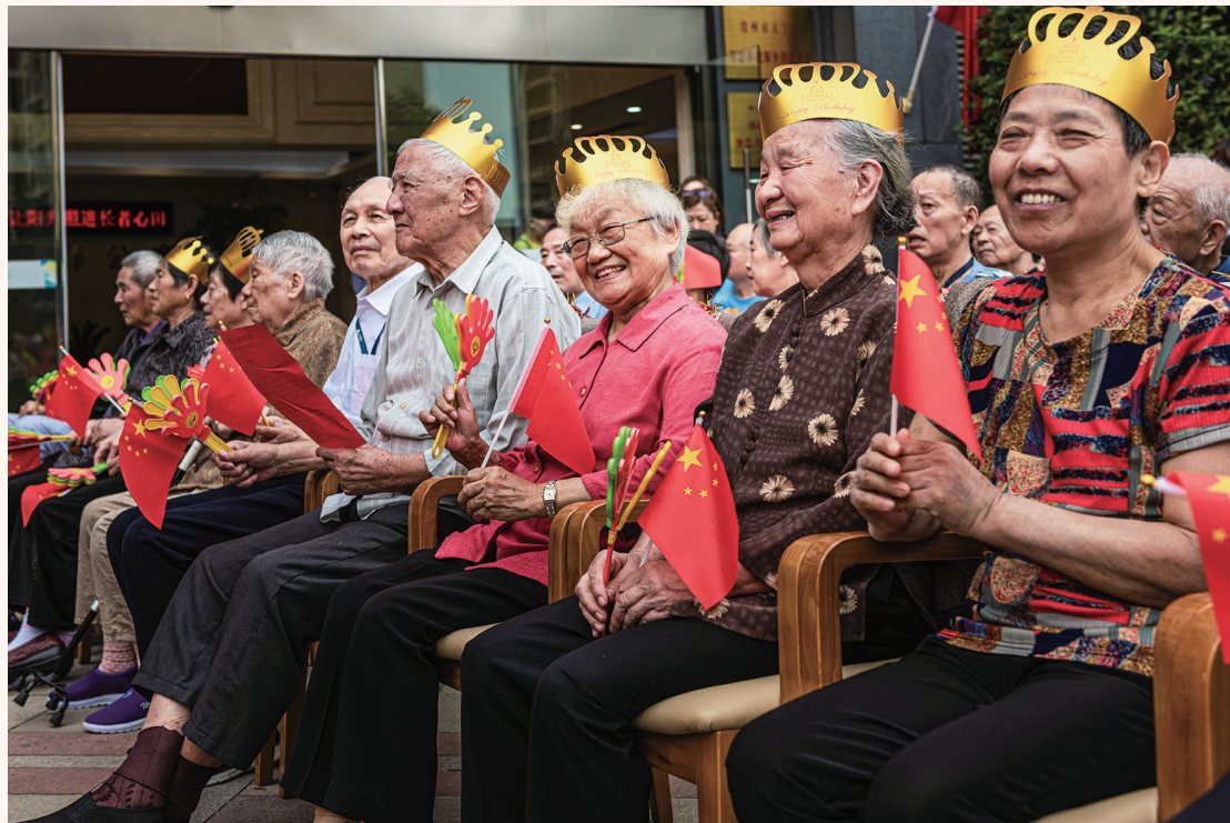
▲ 《幸福的晚年》