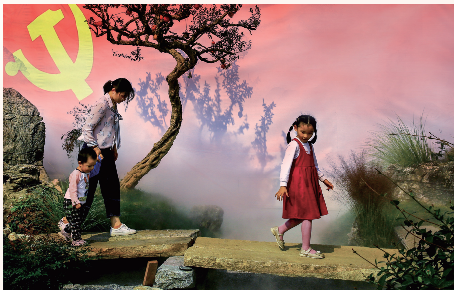
《党旗下的幸福》

为隆重庆祝中国共产党成立100周年,市妇联开展以“党的光辉照万家”为主题的“随手拍”活动,以生动的影像展现在中国共产党领导下的新中国发生翻天覆地的变化,用镜头记录党的光辉照耀下工作和生活的幸福片段。