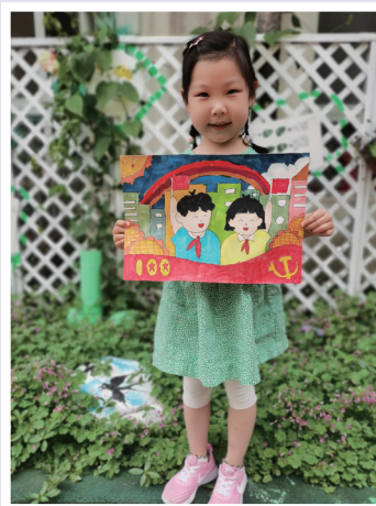
▲ 红溪实验幼儿园萌娃用绘画喜迎建党百年

“我们这一代人亲历了物资匮乏到经济腾飞，而我所在的黄金村也是发生了翻天覆地的变化。从省级贫困村，到全国文明村，我们一步一个脚印走，一棒接着一棒干。我会继续带领村里67名党员、2546位村民共同努力，让黄金村发展有奔头、让黄金人生活有盼头，向中国共产党百年华诞献礼！”